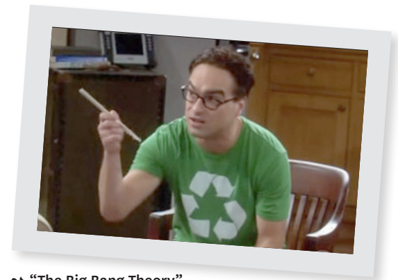
➡ “The Big Bang Theory”

Los personajes que aparecen en sus hogares pueden usar camisetas con mensajes a favor del medioambiente, hacerse vegetarianos, utilizar bolsas de tela al hacer sus compras y conducir un automóvil híbrido o ir en bicicleta.